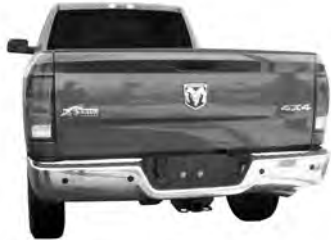
Dodge Ram Pickup

Adaptador del cableado de control eléctrico del remolque